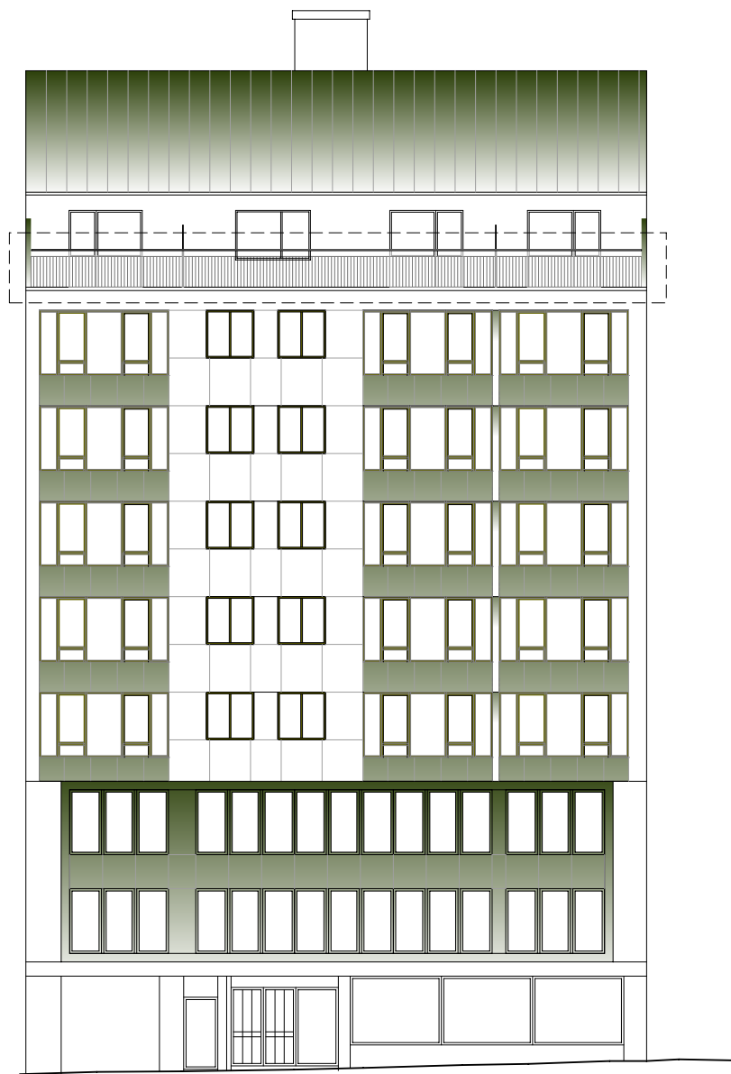
FASAD HUS 2 MOT TULEGATAN