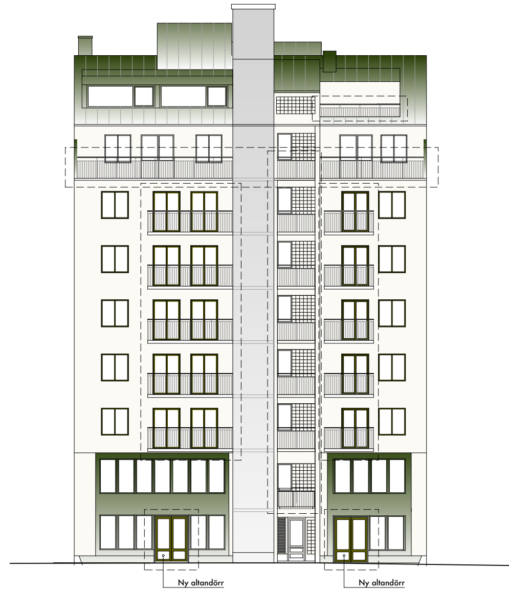
FASAD HUS 2 MOT GÅRD