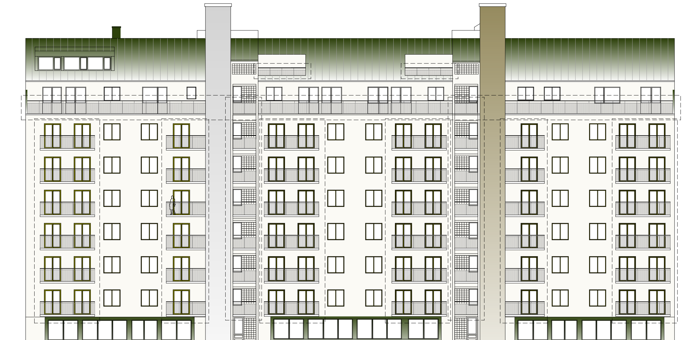
FASAD HUS 1 MOT GÅRD (Nordost)